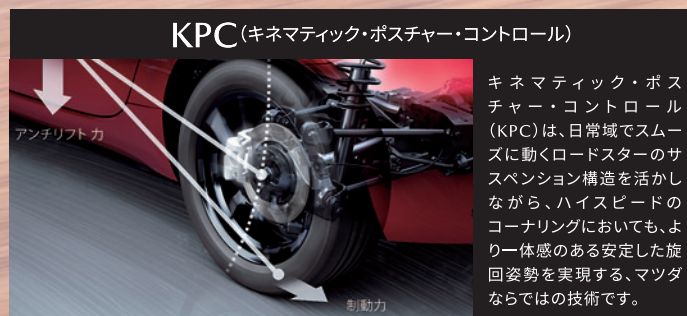
KPC(キネマティック・ポスチャー・コントロール)

キネマティック・ポスチャー・コントロール(KPC)は、日常域でスムーズに動くロードスターのサスペンション構造を活かしながら、ハイスピードのコーナリングにおいても、より体感のある安定した旋回姿勢を実現する、マツダならではの技術です。