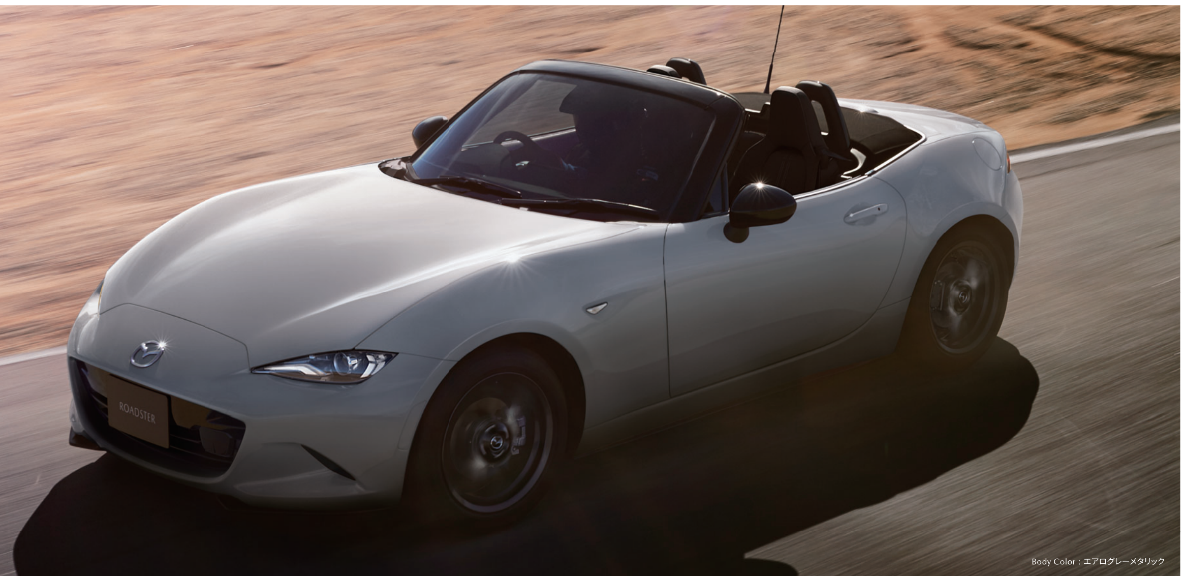
Body Color : エアログレーメタリック

MAZDA ROADSTERは車両本体価格2,898,500円(消費税別)(S/ガソリンエンジンモデル/2WD)からご用意しております。