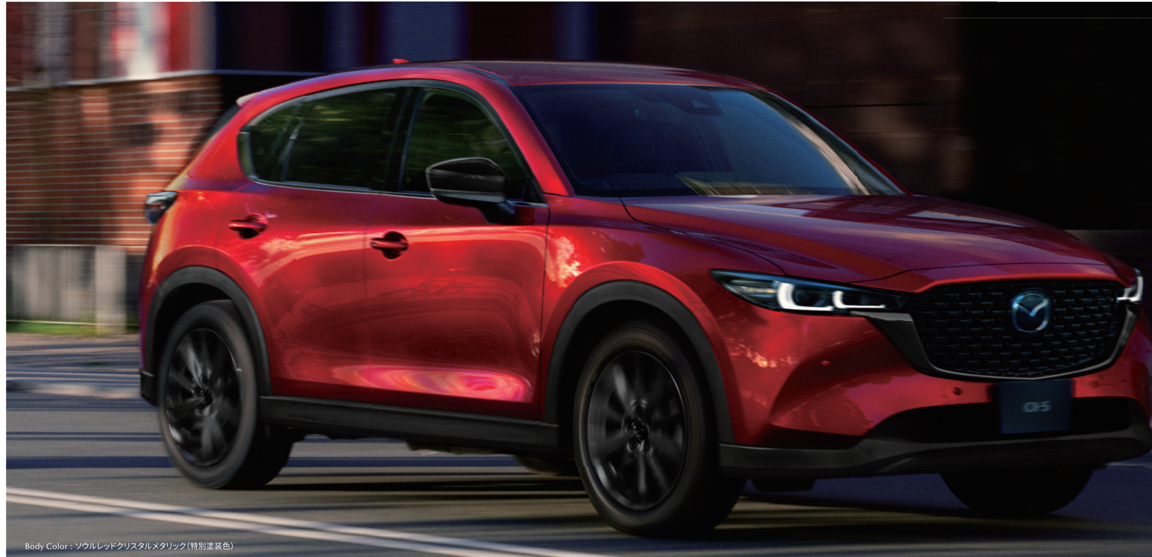
Body Color : ソウルレッドクリスタルメタリック(特別塗装色)